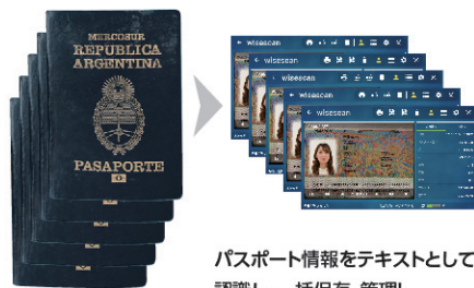
パスポート情報をテキストとして認識し、一括保存・管理!